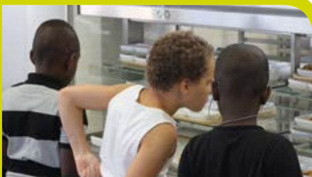
BIENVENUE À LA CANTINE !

M erci de vous présenter à l'accueil de la Caisse des Écoles munis des documents suivants :