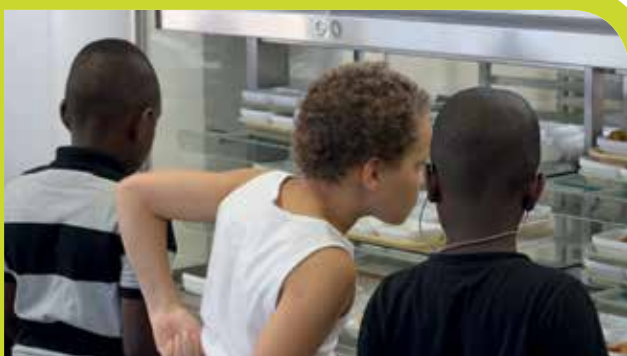
BIENVENUE À LA CANTINE !

M erci de vous présenter à l'accueil de la Caisse des Écoles munis des documents suivants :